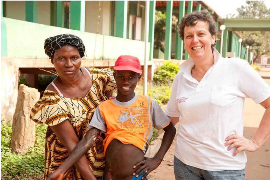
Patiënt uit 2010 met geopereerde brandwondcontractuur kwam trots laten zien hoe goed het met hem ging.